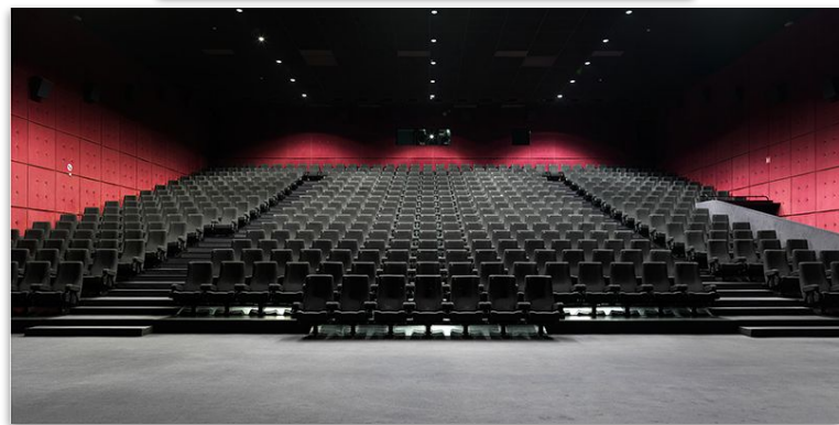
Galerie 360° du Kinépolis Lomme